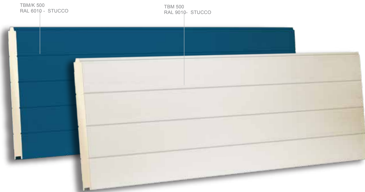
TBM/K 500 RAL 6010 - STUCCO