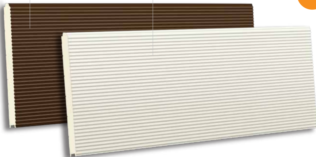
TBR/K V16 610 RAL 9010 - LISSE