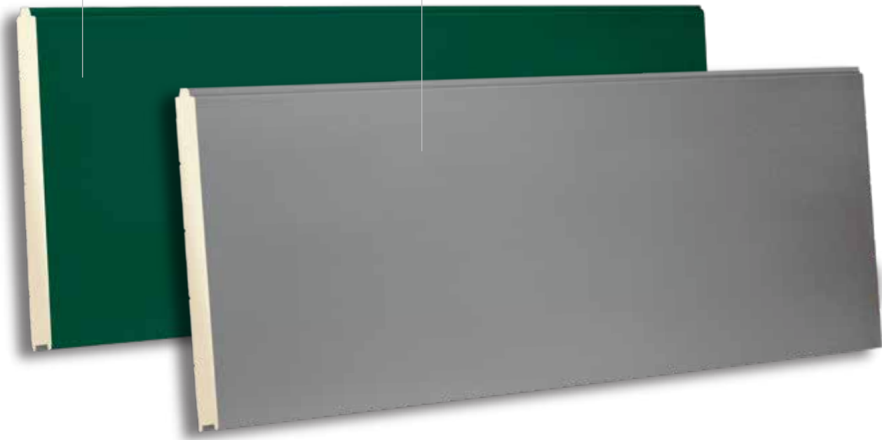
TBX 610 GOOSEWING GREY - STUCCO