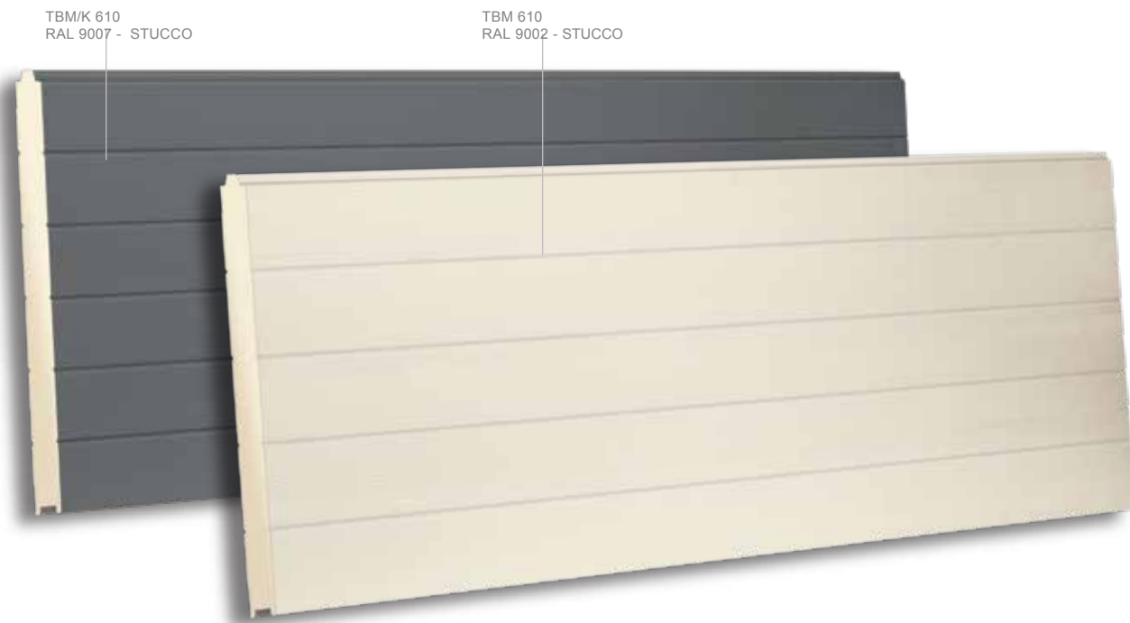
TBM/K 610 RAL 9007 - STUCCO