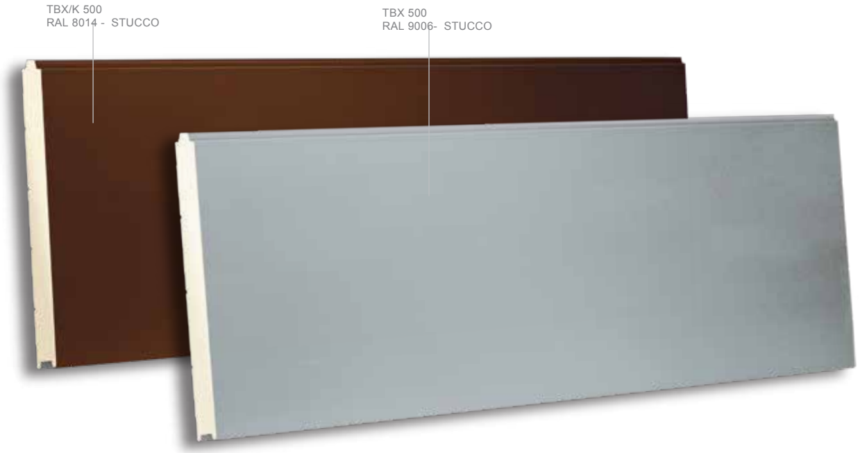
TBX/K 500 RAL 8014 - STUCCO